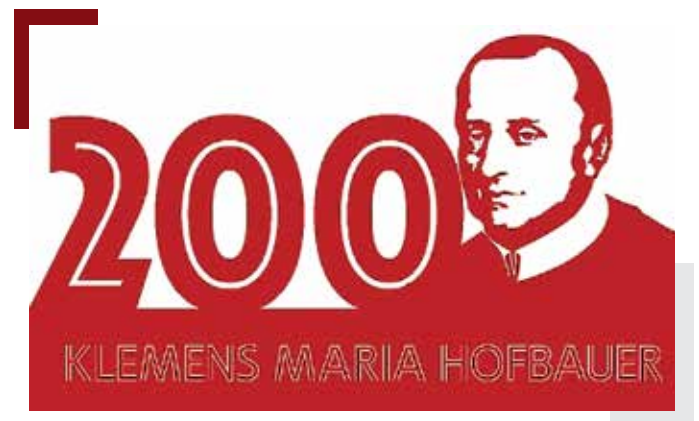
Logo zum Jubiläumsjahr des Hl. Klemens Maria Hofbauer

daran glauben? Mich beeindruckt am heiligen Klemens, dass er immer wieder neu begonnen hat. Er war wahrhaftig ein Pilger– unterwegs auf den Straßen Europas, unterwegs nach Rom und Mariazell. Er hat sich neuen Situationen gestellt und ist kreativ mit ihnen umgegangen. Aus dem, was ist, hat er etwas gemacht und hat nicht lange darüber lamentiert. Geholfen hat ihm sein Glaube. Und er hat so die Erfahrung gemacht, dass auch aus Trümmern Neues entstehen kann, weil Gott uns nicht verlässt, sondern durch alles hindurch mit uns Welt gestalten will. Das löst nicht alle Fragen, die sich uns stellen. Aber es kann uns Mut geben, anzupacken und miteinander neu zu beginnen. Auch in und nach Corona.