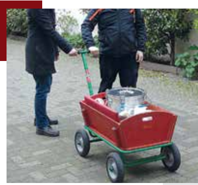
Unterwegs mit dem „Bollerwagen“

auch ein Paket Toilettenpapier für uns mit einkaufen, oder uns anbieten, Schutzmasken zu nähen.