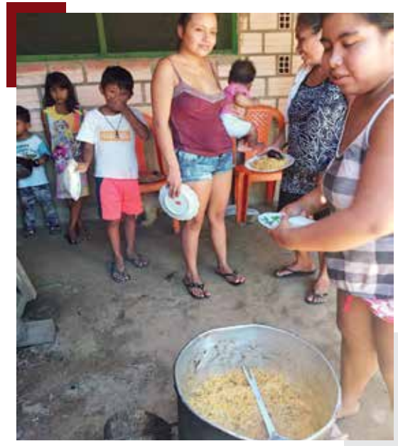
Initiative „Gemeinsamer Topf“ in einem der Dörfer im Gebiet des Rio Beni

Ostersonntag konnten wir eine Autofahrt organisieren, bei der die Statue des Auferstandenen mit Gebet und Gesang durch die Straßen gefahren wurde. So konnten wir die Leute unterstützen und motivieren, ihre Häuser nicht zu verlassen und Solidarität zu zeigen. Es war wunderbar, das strahlende Lächeln von Kindern und Erwachsenen zu erleben, das von Hoffnung und Dankbarkeit gesprochen hat, trotz des für Südamerika sehr ungewohnten Abstandhaltens.