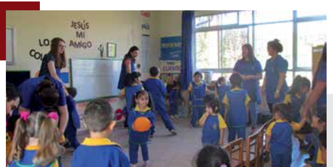
Frohe Stunden im Kindergarten