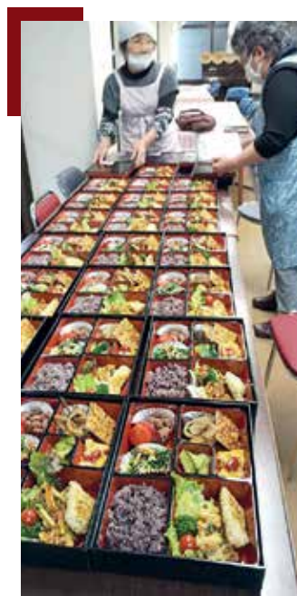
Lunchpakete für die Senioren in Kagoshima

talisierung bin ich noch nicht so vertraut, aber man kann ja noch lernen. Mit zunehmendem Alter werden die körperlichen Beeinträchtigungen mehr, aber schließlich ist unser Auftrag auch das Beten. In der Pfarrei haben wir jetzt ca. 50 Kranke, die besucht sein wollen. Ich schliesse sie je einzeln ins Gebet ein und ich, bete auch für die vielen Getauften, die der Kirche fernbleiben. Gottes Führung zeigt uns immer neue Wege. Wir müssen nur Mut haben, sie zu gehen.