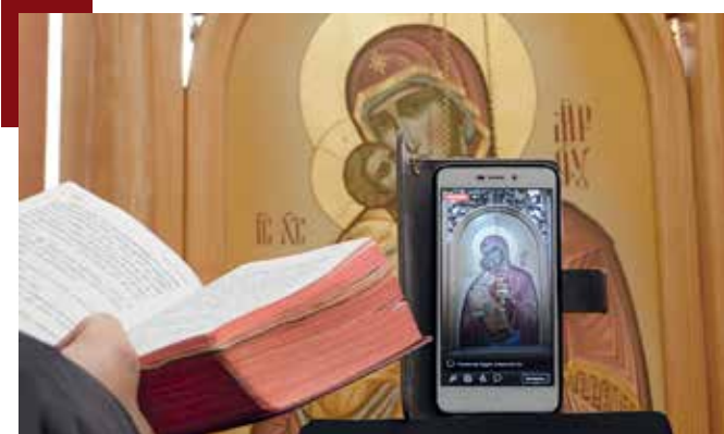
Liveübertragung des Gottesdienstes aus der Kirche in Chernihiv

Zwar begrenzt die heutige Situation die Möglichkeiten sich zu treffen, verschließt viele Türen unserer Häuser und Kirchen, doch die Türen unserer Herzen können immer offen bleiben.